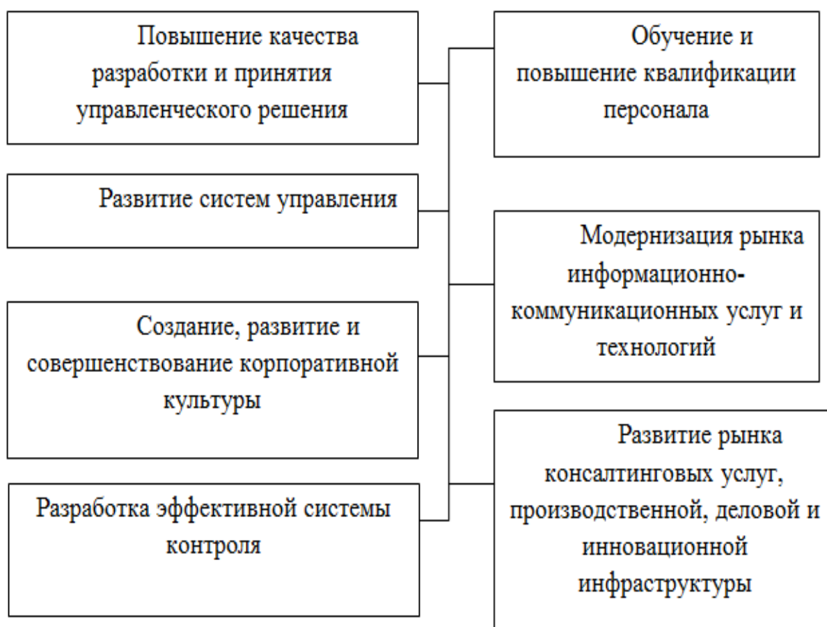
Рисунок 2 - Пути повышения эффективности принятия управленческих решений в компании ООО «Макдоналдс»

Рассмотрим на рис. 2 пути повышения эффективности принятия управленческих решений в компании ООО «Макдоналдс».