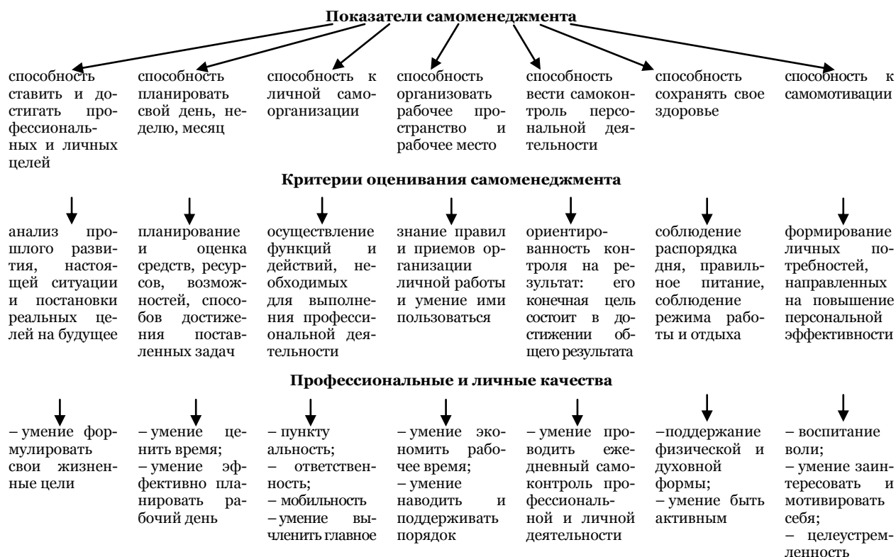
Рис. 2. Соотношение показателей и критериев сформированности самоменеджмента бакалавров по социальной работе

Проанализировав рис. 2, мы можем прийти к выводу, что к показателям самоменеджмента относятся способность бакалавра социальной работы к самоорганизации, целеполаганию, планированию, самоконтролю, самомотивации. В свою очередь, к критериям оценивания относятся: наличие знаний, умений и навыков самоменеджмента, а также сформированные профессиональные и личные качества, направленные на результативное выполнение профессиональной деятельности, предотвращение профессионального выгорания, что приводит к профессиональному долголетию.