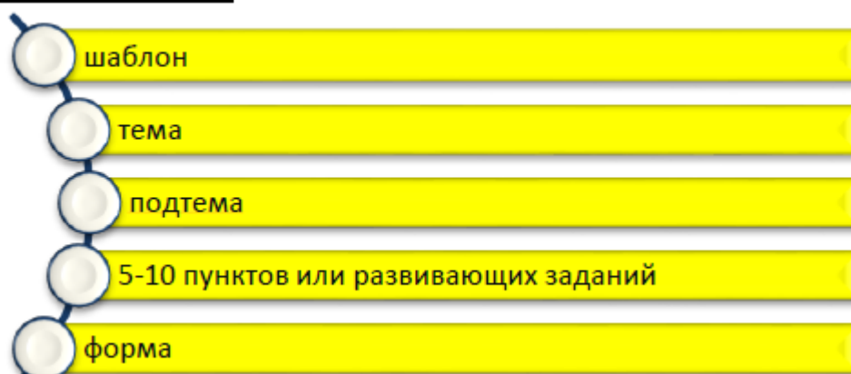
Рисунок 3. Алгоритм работы по Лэпбуку