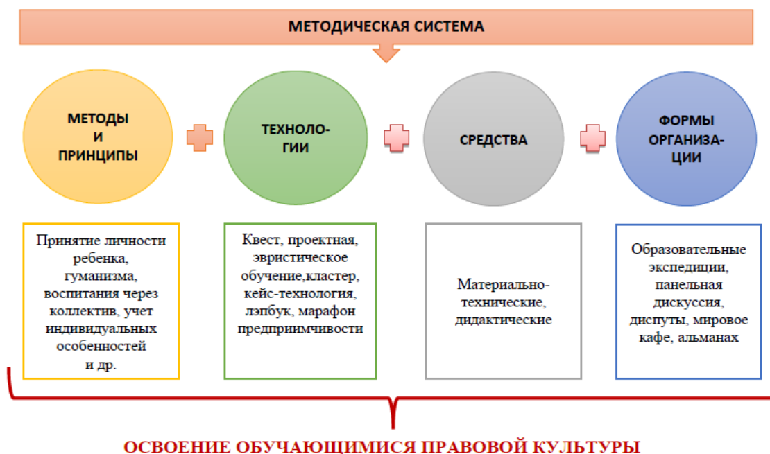
Рисунок 2. Методическая система формирования правовой культуры

Формированию и совершенствованию всех видов универсальных учебных действий на уроках правовых знаний может способствовать следующая методическая концепция, основанная на интерактивных стратегиях обучения.