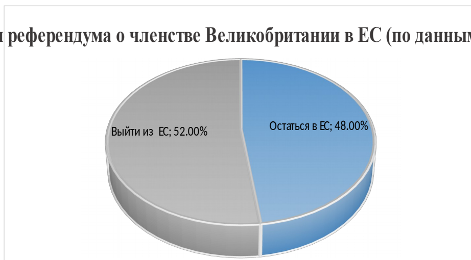
Рис.1. Итоги референдума о членстве Великобритании в ЕС (по данным BBC)

На протяжении всей истории и по сей день проблемными вопросами во взаимоотношениях Великобритании и ЕС являются: