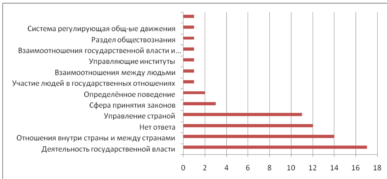
Рис. 1. В Вашем понимании, что такое политика?