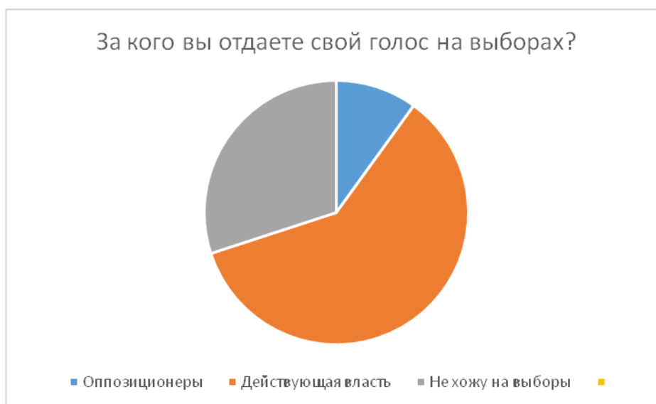
Рис. 5. Предпочтения на выборах

испытуемых категорически не ходят на выборы, поскольку не считают это целесообразным.