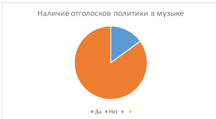
Рис. 4.Наличие отголосков политики в музыке

Отголоски политики в современной музыке находят лишь 15 % опрошенных, остальные 85 % не видят связь политики с музыкой.