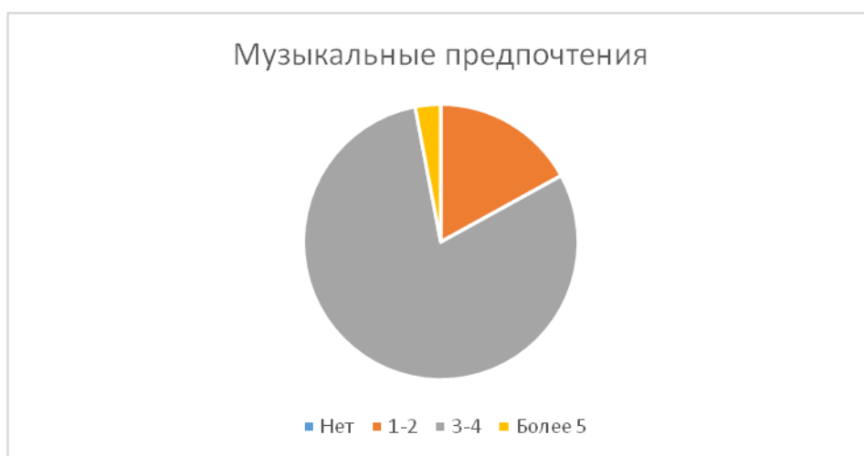
Рис. 1. Музыкальные предпочтения

На вопрос о наличии музыкальных предпочтений ответы были почти схожими. У 80% опрошенных музыкальные предпочтения находятся в количестве 3-4 музыкальных исполнителей. Что может говорить нам о не слишком большой заинтересованности данным культурным явлением.