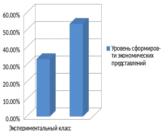
Рис. 1. Различия в сформированности экономических представлений у учеников 6 «А» (экспериментального) класса и 6 «Б» (контрольного) класса.

По итогам констатирующего эксперимента были сделаны следующие выводы: