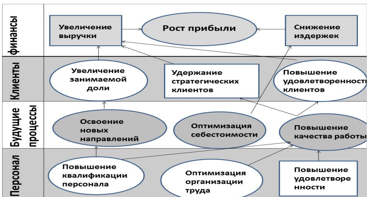
Рис. 2.1.1. Модель стратегической карты негосударственной образовательной организации

Но, к сожалению, не всегда, план реализуется и выполняется полностью. На него могут повлиять различные независимые от нас условия, и поэтому отклонение от плана неизбежны. При этом руководителю при выявлении отклонений необходимо стремиться к возврату на плановую траекторию движения, но для этого понадобятся дополнительные ресурсы (финансовые, материальные, кадровые) или заранее спрогнозировать отклонения и учесть их при составлении на новый год.