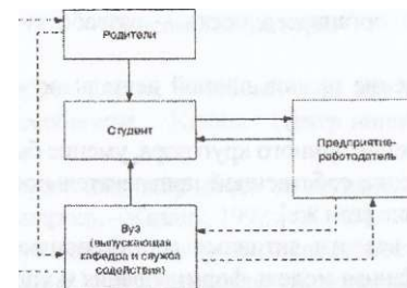
Рис. 1 Субъекты обеспечения конкурентоспособности студента

По мнению С.Д. Резника, А.А. Социловой « субъектами обеспечения личной конкурентоспособности студента могут выступать: высшее учебное заведение в лице общеузовских служб содействия и выпускающей кафедры, предприятия-работодатели, родители студента и, конечно, сам студент» [9] (рис. 1).