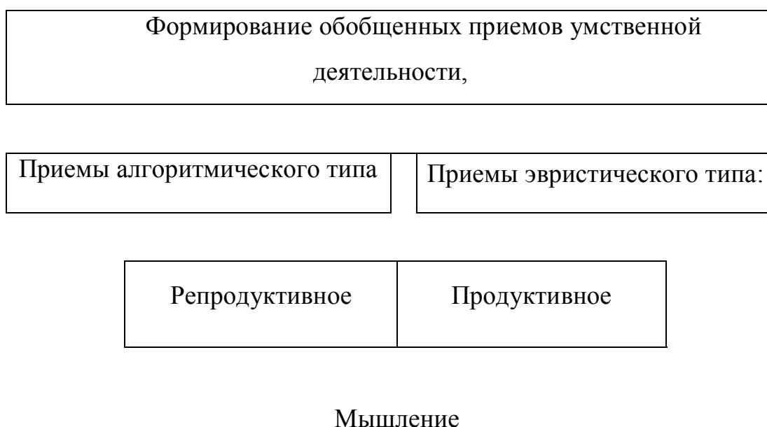
Рис.5 Взаимосвязь приемов умственной деятельности с видами мышления

Рассматривая формирование обобщенных приемов умственной деятельности, З.И. Калмыкова [33] делит их на две большие группы - приемы алгоритмического типа и эвристические. Первые представляют собой приемы рационального, правильного мышления, полностью соответствующего законам формальной логики. Такие приемы определяют последовательность действий с целью безошибочного решения задач. Однако формирование алгоритмических приемов умственной деятельности является необходимым, но не достаточным условием развития творческого мышления учащихся. Алгоритмические приемы - основа формирования репродуктивного мышления. Установим взаимосвязь между формированием обобщенных приемов умственной деятельности и мышлением (рис.5)