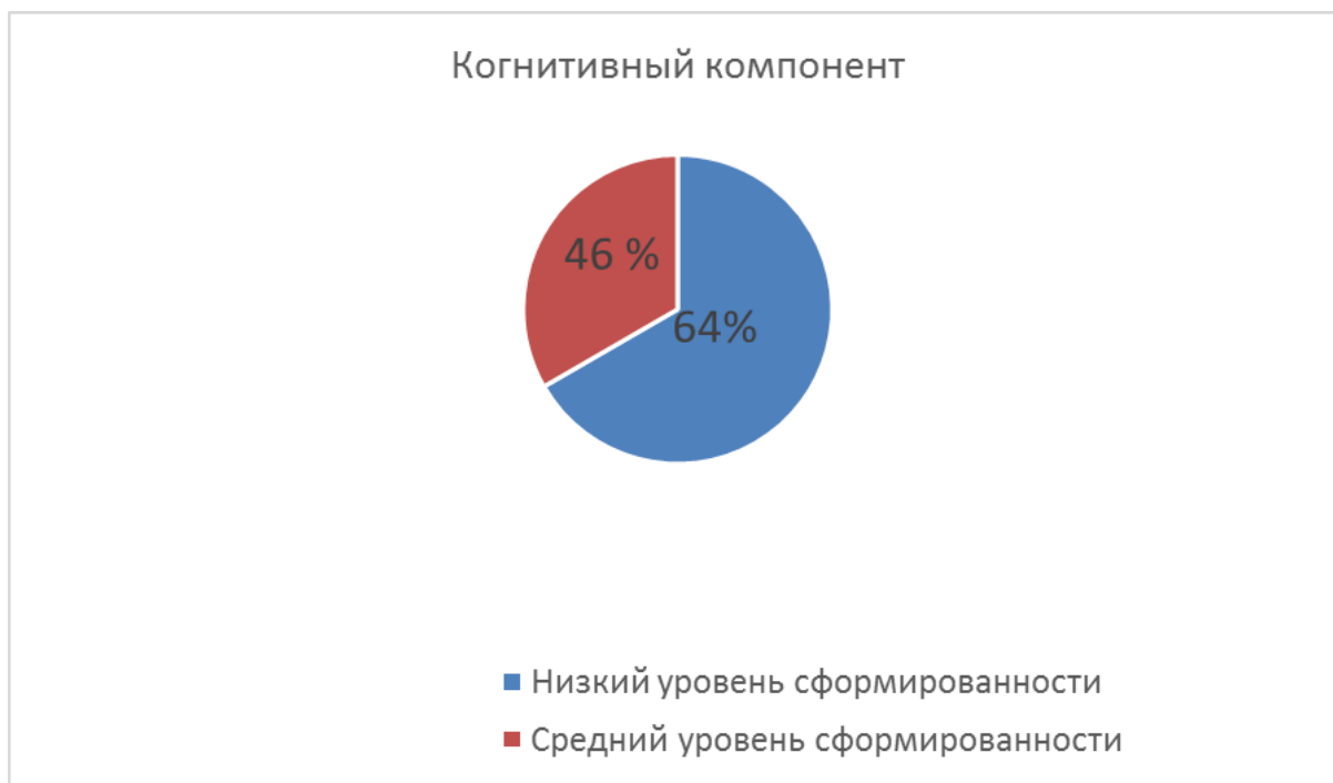
Рис. 2 Уровень сформированности когнитивного компонента правовой компетенции

В рамках когнитивного компонента мы зафиксировали, что из 28 опрошенных никто не обладает высоким уровнем правовых знаний; 18 (64%) респондентов показывают недостаточно точные правовые знания, минимальное понимание правовой информации; у 10 (36%) старших подростков обнаружен низкий уровень (отрывочные знания в правовой сфере, минимальное понимание правовой информации, непониманием нравственного смысла закона). Результаты представлены на рисунке 2.