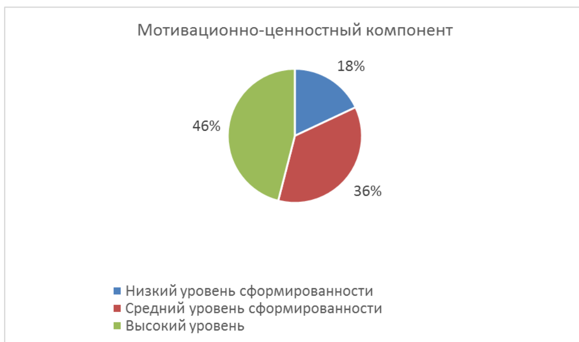
Рис. 3 Уровень сформированности мотивационно-ценностного компонента правовой компетенции

самообразованию в области правовой компетенции, осознание прав и обязанностей как ценности, добровольное и сознательное исполнение правовых предписаний. Результаты представлены на рисунке 3.