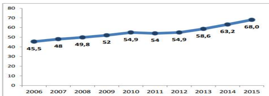
Рис. 3. Доля детей в возрасте от 5 до 18 лет, охваченных программами дополнительного образования [43].

– участвовать во фронтальных, групповых и индивидуальных занятиях и мероприятиях, в том числе с участниками других творческих объединений, учащихся учреждения (организации) дополнительного образования детей; – ориентироваться (выбирать) на индивидуально благоприятный режим деятельности и отдыха, опираться на свои возрастные, физиологические и психологические (типологические) особенности, учитывающие пожелания родителей, санитарно–гигиенических нормативные требования; – использовать родительское участие (помощь родителей на временной основе) при подготовке и реализации совместной деятельности творческого детского объединения (требуется наличие соответствующих психолого–педагогических условий, соблюдение организационных моментов, согласия руководителя творческого объединения). По данным на 2015 год общий охват дополнительным образованием детей в возрасте от 5 до 18 лет составляет 68% от общей численности детей соответствующего возраста. В общеобразовательных организациях дополнительными общеобразовательными программами (кружковой работой) охвачены 12 188 205 детей рассматриваемого возраста (46,54%) . В организациях дополнительного образования (ОДОД) обучается 10 861 391 детей (41,8%).%) [43]. Дополнительными общеобразовательными программами охвачены также 12 778 393 человека в организациях дошкольного и среднего профессионального образования. %) [43].