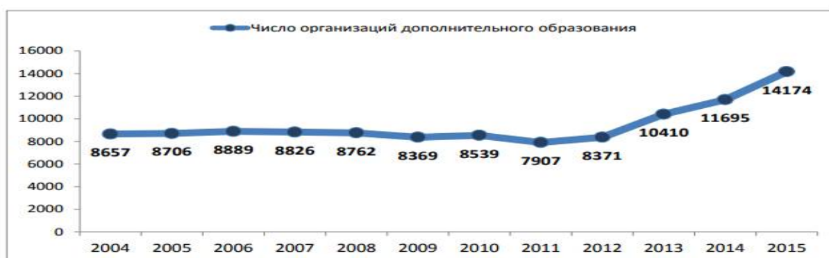
Рис. 2 Динамика численности ОДОД по данным Росстата, 2004–2015 годы[13, с. 4]

На этапе перехода к межведомственной статистике прирост организаций составил более 2 тысяч (около 24%). Это не позволяет говорить о полной надежности данных на этапе 2013/14 годов. [24].