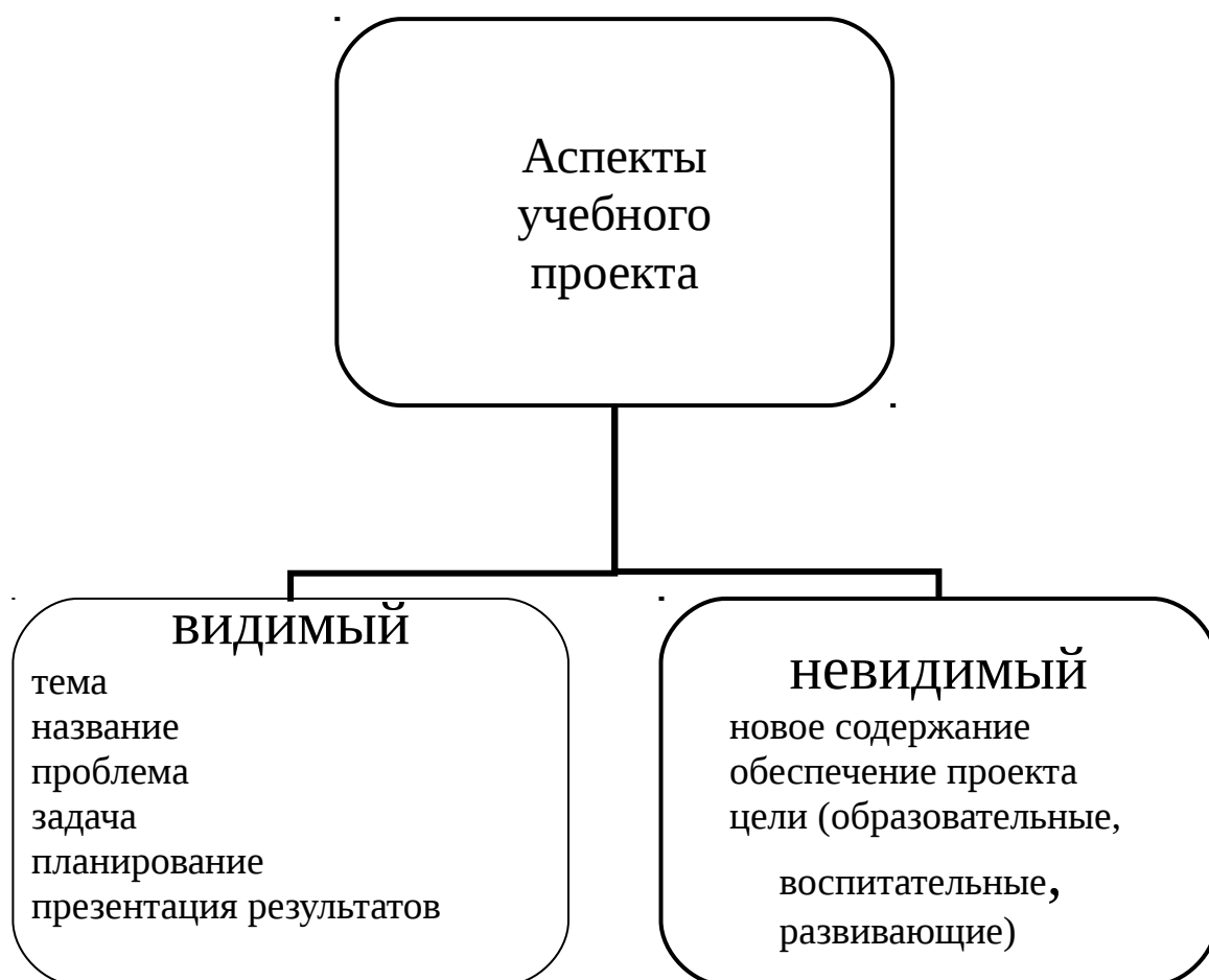
Рис. 1. Содержание учебного проекта

Существуют как бы два плана, две плоскости описания учебного проекта, проектной деятельности учащихся – видимый и не видимый для учащихся (рис. 1). В проекте есть проблема, интрига, ситуация. Ее ученики рассматривают вместе с учителем, чтобы понять важность, актуальность, острую необходимость решения проблемы. Определяется цель поиска приемлемого способа решения проблемы. Одной из задач учеников становится максимально наглядный показ найденного решения. На первый взгляд, ничего общего с прохождением (изучением) программного материала по какому-то конкретному учебному предмету.