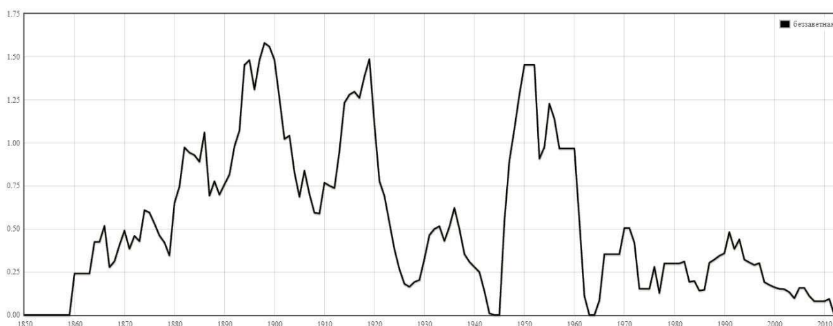
Рис. 3. Частотность формы «беззаветная»

Что касается степени идиоматичности лексемы беззаветный , функционирующей в литературном языке, то очевидно, что внутренняя форма этого слова затемнена, о чем свидетельствует хотя бы разрыв между значениями префиксальной конструкции с без- и приставочной лексемы: беззаветный 'самоотверженный и героический (высок.)' [Шведова 2007: 36] и заветный 'сокровенный, душевный', 'свято хранимый, оберегаемый, дорогой по воспоминаниям', 'скрываемый от других, тайный' [Там же]. Очевидны разные направления семантического развития образования с без- и производящей основы, однако можно предположить, что дополнительным фактором идиоматизации и стирания внутренней формы слова является собственно процесс префиксации с формантом без- .