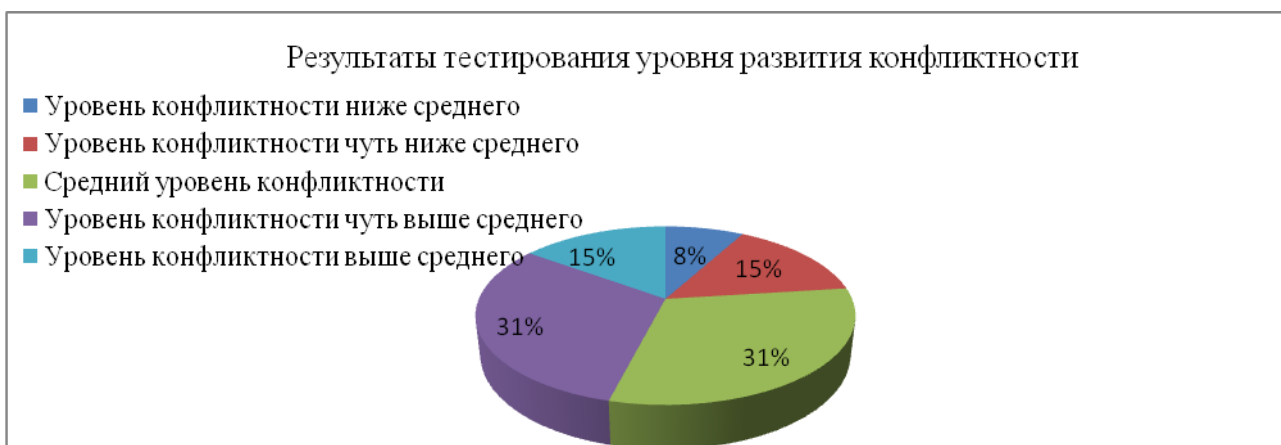
Рис. 2. Уровень развития конфликтности учащихся 10 класса

По результатам теста В. Ф. Ряховского можно сделать вывод, что у учащихся 10 класса средний и чуть выше среднего уровень развития конфликтности (см. Рисунок 2).