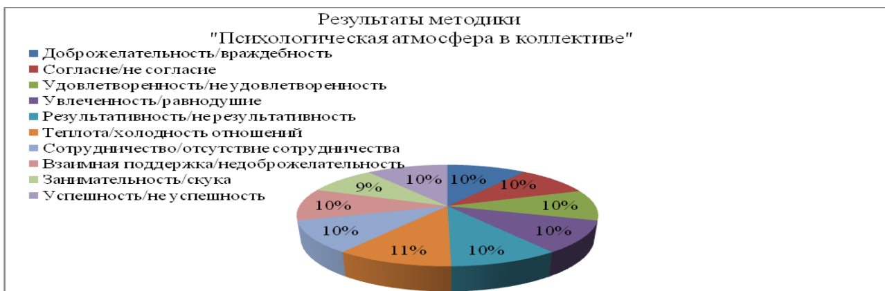
Рис. 3. Психологическая атмосфера в коллективе 10 класса

Таким образом, на основании использованных методов и проведенных методик для исследования первичной диагностики уровня конфликтности старших подростков в школе, можно сделать следующие выводы.