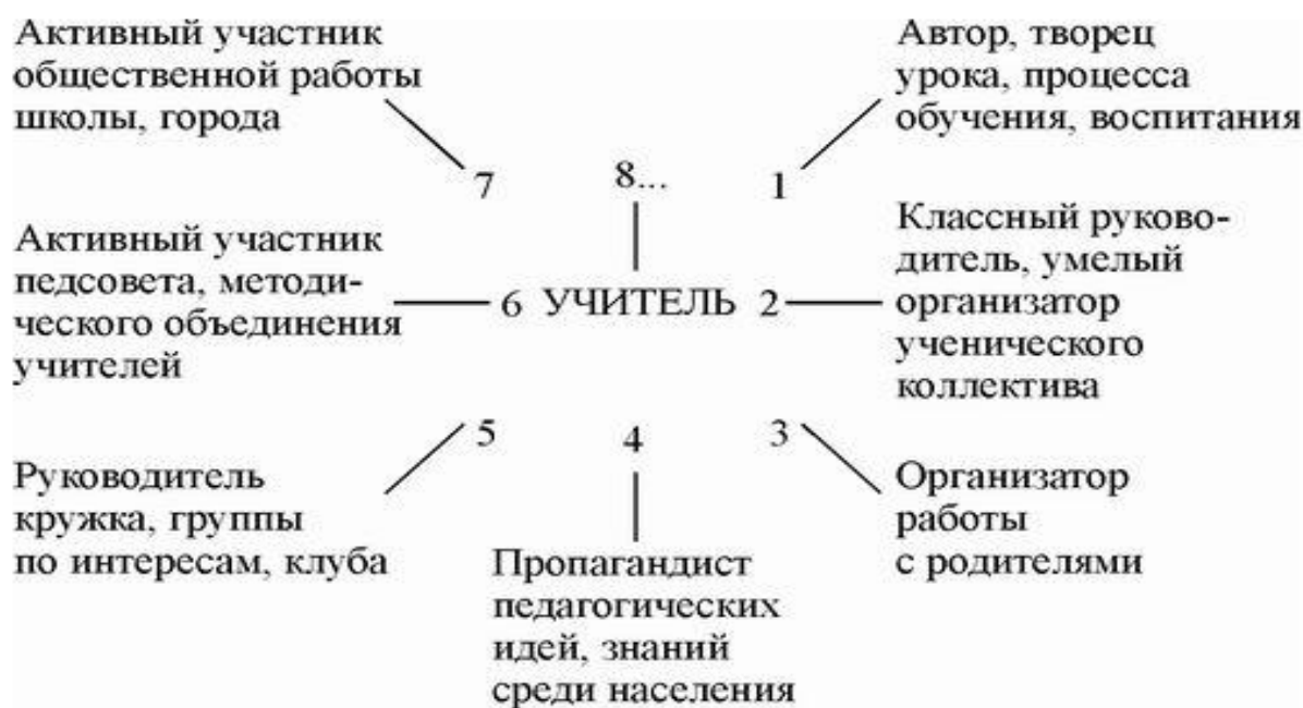
Рис. 2. Характеристика основных черт современного учителя

обучающихся и (или) организации образовательной деятельности» [40]. Выходит, что учитель-это человек, стремящийся к совершенствованию в той предметной области, которой он занимается, а также, владеющий современными технологиями и подходом к обучению. (Схема 2).