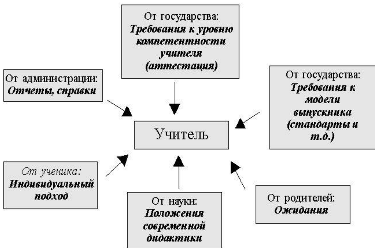
Рис. 1. Разнообразии требований к современному учителю

Федеральные государственные стандарты нового поколения принципиально изменили место и роль школы в обществе. Соответственно изменились роли директоров и педагогического состава. Современная школа не только выполняет социальную функцию, но и учитывает особенности отдельно взятых учеников и даже их родителей, обеспечивая индивидуальный подход к каждому. В современной школе происходит негласное заключение договора между государством, личностью учащегося, его семьей и другими заинтересованными сторонами. Каждый участник образовательного процесса возлагает на современного педагога свои ожидания, которые необходимо оправдать. (Схема 1).