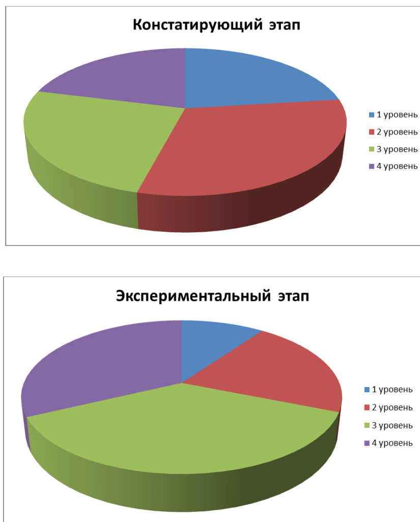
Рис. 3. Уровень дисциплинированности суворовцев в ходе констатирующего и экспериментального этапов

характеристики всем учащимся опытных групп, каждый из которых был отнесен к одной из групп в соответствии с уровнем развития исследуемой компетенции. Как видно из приведённых данных (рис. 3), количество обучающихся участников нашего эксперимента, проявивших 1 уровень дисциплинированности, составляет незначительную часть, по сравнению с данными констатирующего эксперимента (ниже в 4 раза).