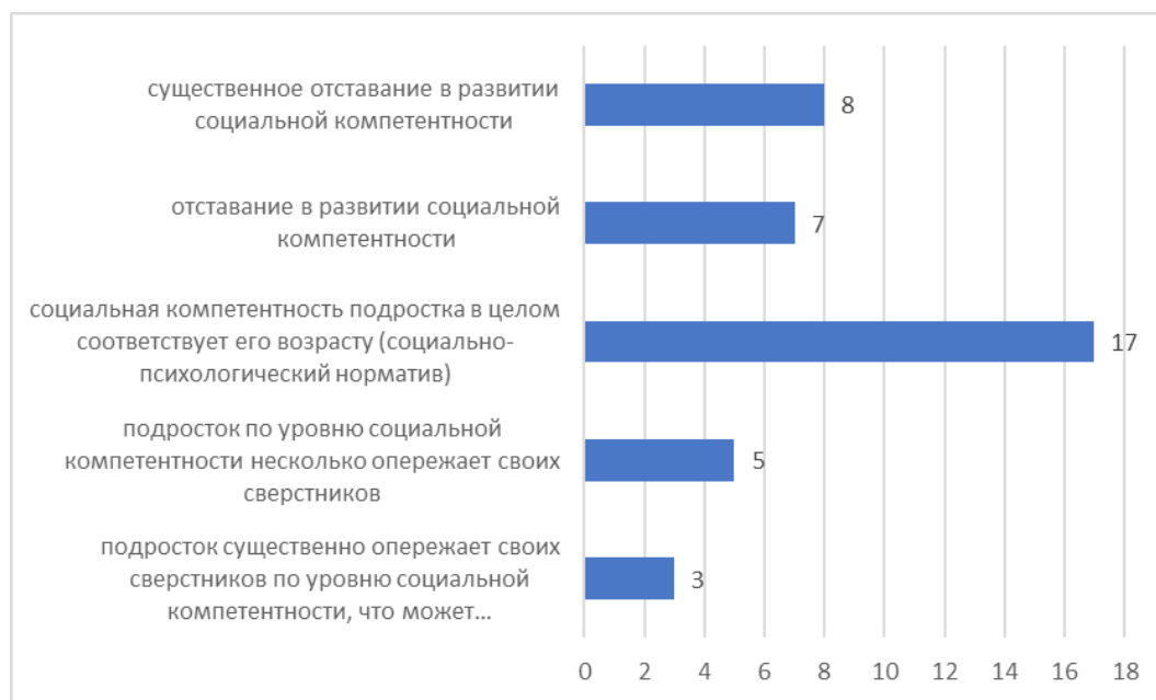
Рис. 2. Социальная компетентность подростков, обучающихся в МБУ ДО ДЮСШ «Олимпик»

Соответствие социальной компетентности подростков, обучающихся в МБУ ДО ДЮСШ «Олимпик», возрастной норме (см. Приложение 1), представлено на рисунке 2 (см. Рис. 2).