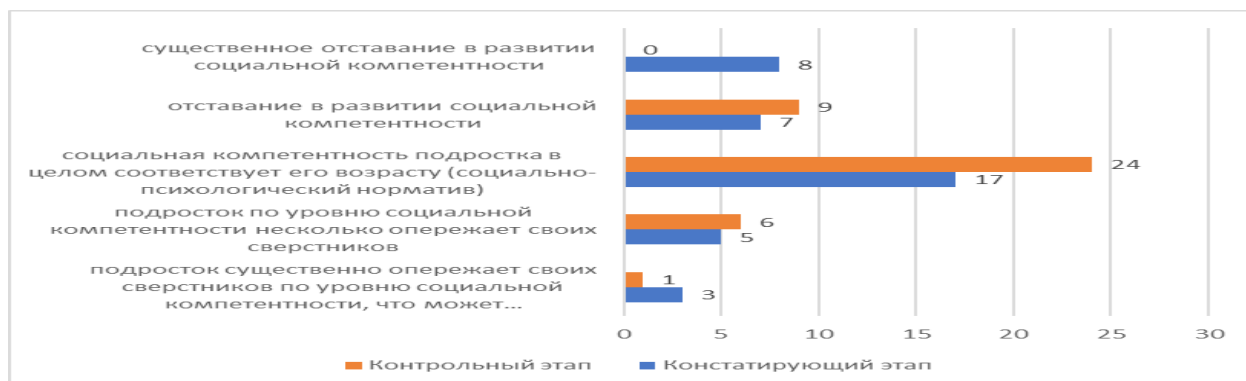
Рис. 5. – Сравнение данных, полученных на констатирующем и контрольном этапах

Сравнительный анализ результатов констатирующего и контрольного этапов представлен на рис. 5 (см. Рис. 5).