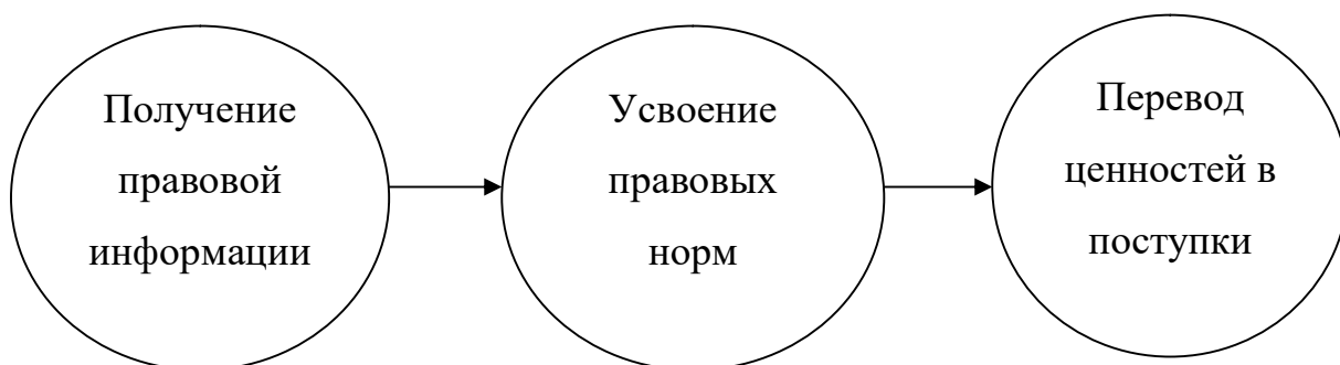
Рисунок 1. Схема процесса правового воспитания.

реальные поступки. Схема процесса правового воспитания отражена в рисунке 1.