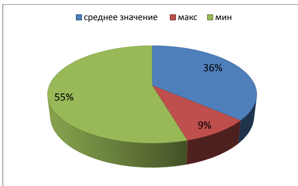
Рис. 2 Процентное распределение испытуемых по методике «Рисованный Апперцептивный Тест» Л. Собчик.

Эта методика применяется для изучения личностных проблем подростка. С помощью механизмов идентификации и проекции выявляются глубинные, не всегда поддающиеся контролю сознания переживания, а также те стороны внутреннего конфликта и те сферы нарушенных межличностных отношений, которые могут в значительной степени влиять на поведение подростка и учебный процесс.