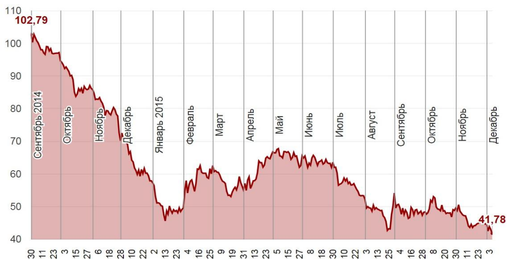
Рис. 4. Изменение стоимости цен на нефть в 2014 году

С политической точки зрения США вмешивается во внутренние дела иностранных государств. Прямое или косвенное воздействие на правительство превращает зависимое государство в марионетку США..