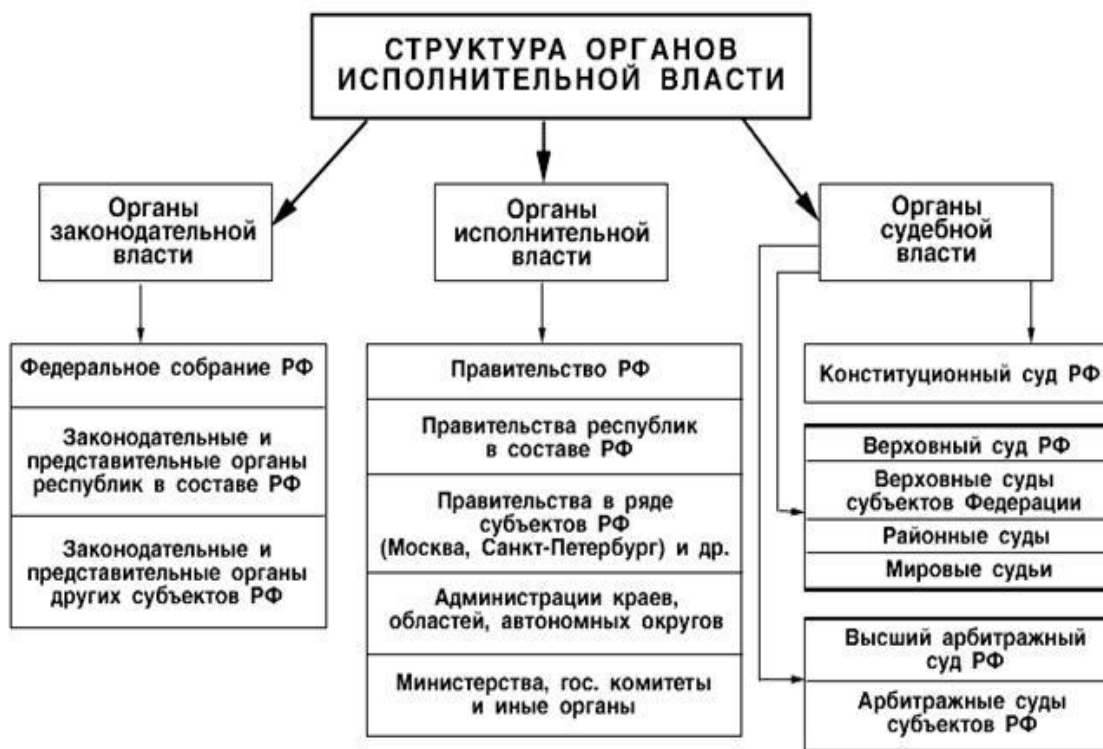
Рис. 2. Структура органов исполнительной власти РФ

Высшим институтом исполнительной власти РФ является правительство. Возглавляет его председатель правительства. Данная должность идентична посту премьер-министра в других странах.