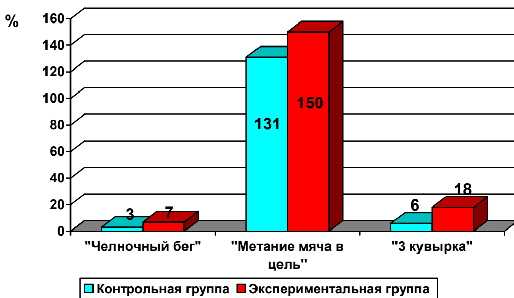
Рис. 1. Прирост показателей координационных способностей детей младшего школьного возраста в % соотношении в контрольной и экспериментальной группе.

Результаты сравнительного анализа развития координационных способностей у детей младшего школьного возраста показали, следующее: