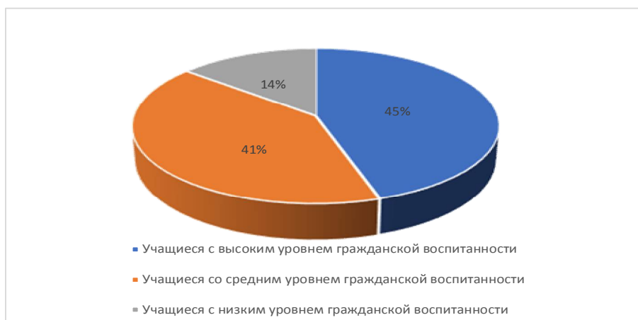
Рис. 2. Результаты метода «Альтернативный тезис»

Результаты методики «Альтернативный тезис» учащихся представлены ниже (см. рисунок 2)