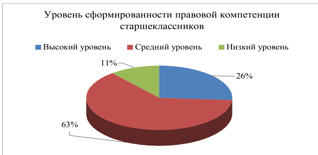
Рис. 5. Уровень сформированности правовой компетенции старшекласников

Затем на основании данных были проанализированы все уровни сформированности правовой компетенции, можно сделать вывод о том, что из 51 обучающихся 11-х классов, у 63% – 32-х обучающихся наблюдается средней уровень правовой компетенции, высокий уровень правовой компетенции выявлен у 26% – 13-ти обучающихся, 11% – 6-ро обучающихся показали низкий уровень правовой компетенции (рисунок 5).