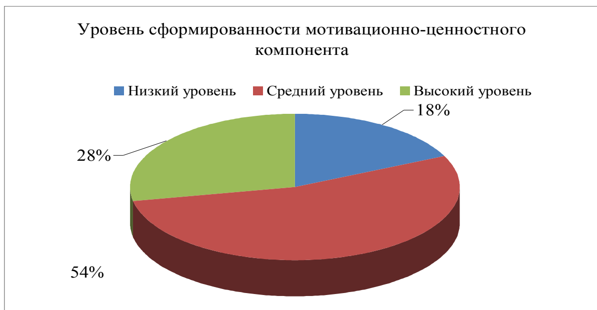
Рис. 3. Уровень сформированности мотивационно-ценностного компонента

С учетом возможностей вариативной части методики нами был добавлен пункт «право (законность в поступках, уважение прав и свобод других, справедливость в отношениях)» в блок «терминальные ценности». Нами были определены уровни ориентации обучающихся на ценность «право» следующим образом: высокий уровень направленности личности на ценность «право», если обучающиеся в иерархии ценностей ставят «право» с 1-ой по 6-ю позиции, средний уровень – с 7-ой по 12-ю позиции, низкий уровень – с 13-ой по 18-ю позиции. Распределение обучающихся представлено на рисунке 3.