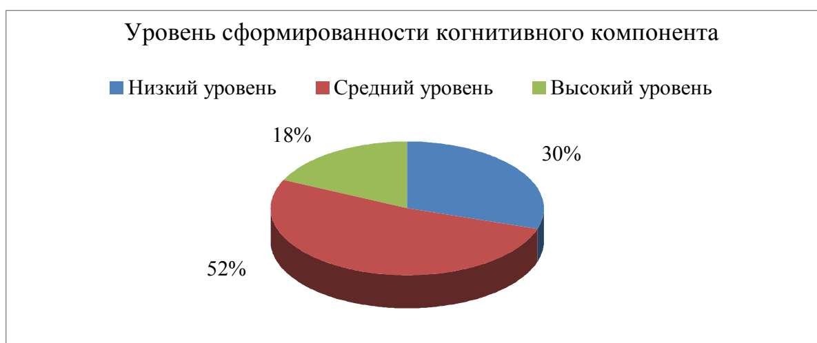
Рис. 2. Уровень сформированности когнитивного компонента

Низкий уровень правовых знаний ставится в том случае, когда в ответе обнаруживается недостаточно глубокое понимание проблемы, отсутствуют собственные оценки сказанного, проявляются умения лишь репродуктивно излагать материал.