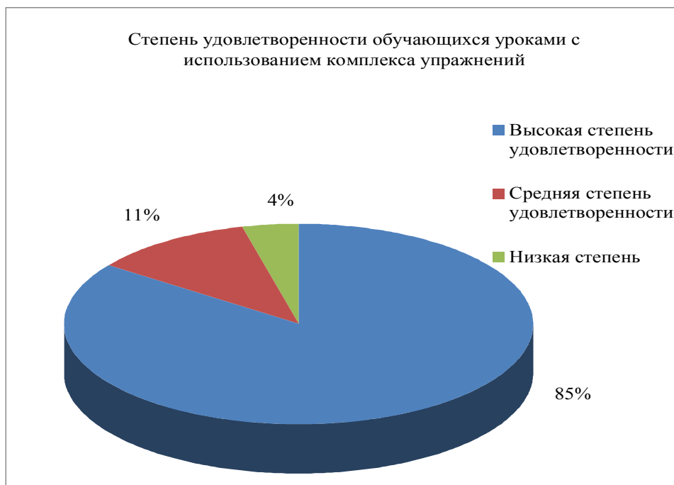
Рис. 6. Степень удовлетворенности обучающихся уроками с использованием комплекса упражнений

Результаты опроса представлены на рисунке 6.