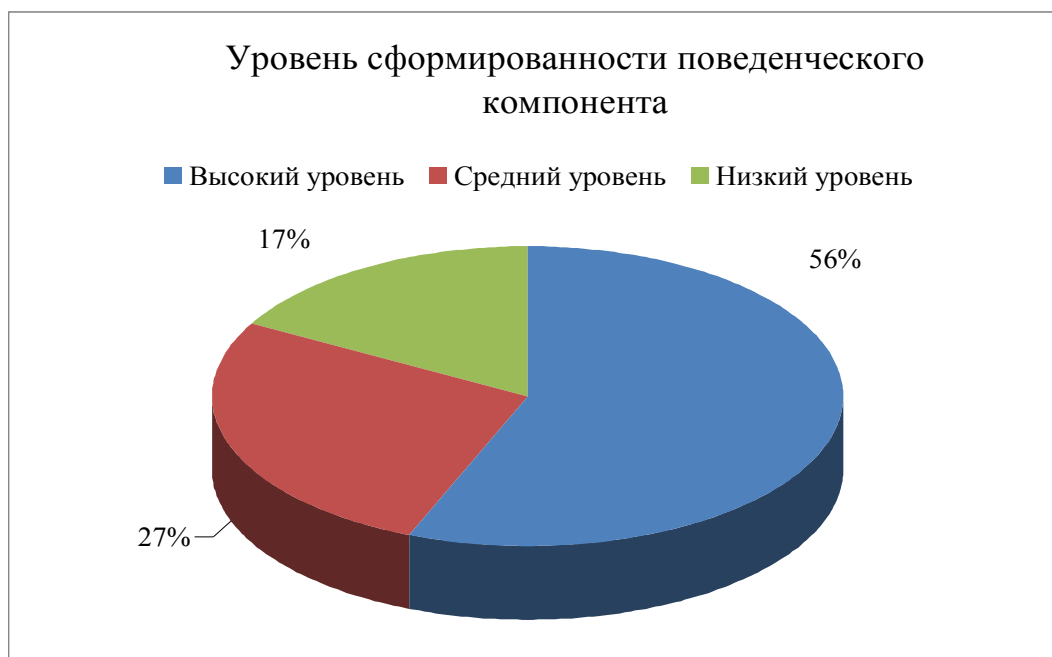
Рис. 4. Уровень сформированности поведенческого компонента

Распределение обучающихся по количеству полученных баллов представлено на рисунке 4.