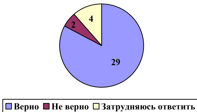
Рис 4. Верно ли, что все люди имеют одинаковые права, независимо от пола, расы, национальности и языка?

На рисунке 3 видно, что 14 человек считают курение в общественном месте административным правонарушением, соответственно знакомы с отраслью административного права, 14 человек считают, что данное деяние наказывается социальным порицанием. 6 человек считают, что курение в общественном месте не является наказуемым и 2 человека затруднились ответить на данный вопрос.