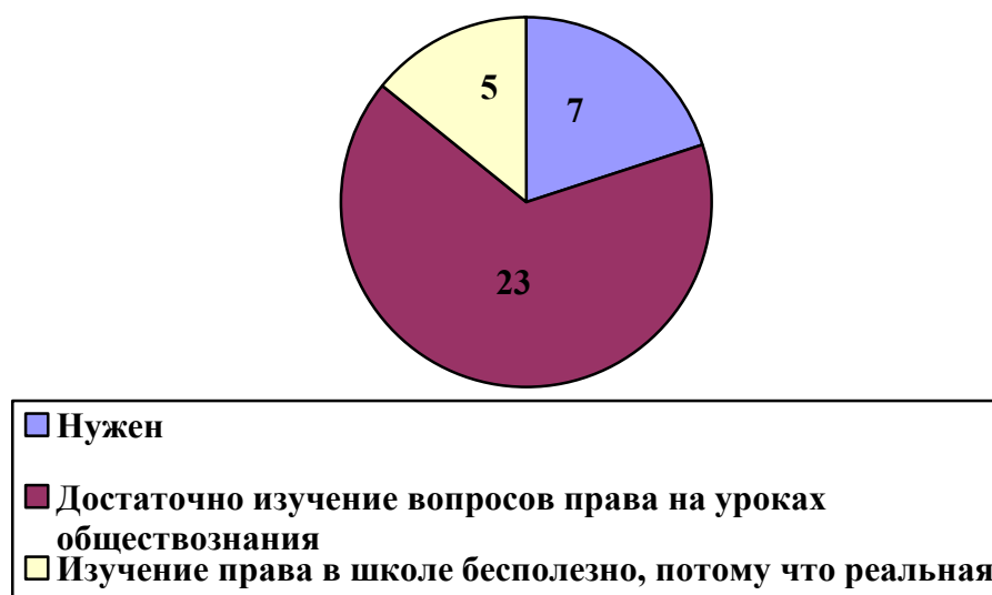
Рис 6. Как вы считаете, нужен ли отдельный предмет «Право» в учебной программе?

На рисунке 5 наблюдается, что только 21 человек готовы, соблюдать нормы права, 8 человек считают, что закон нужно соблюдать исходя из личных интересов, 4 человека считают, что закон нужно соблюдать, только если его соблюдают органы власти и 2 человека считают, что закон соблюдать не стоит, все это говорит о неуважении к закону и непризнании его ценности.