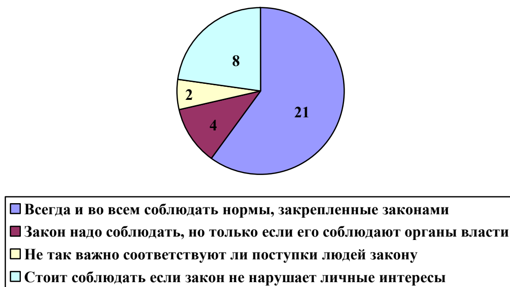
Рис 5. Как вы думаете, как надо относиться к закону?

РФ, 23 человека знают, что алкогольное опьянение не является смягчающим обстоятельством при совершении преступления, соответственно знакомы с отраслью уголовного права, 14 человек, считают, что курение является административно-наказуемы деянием, соответственно осознают, что такое административная ответственность, но также 14 человек не осознают, что за некоторые виды правонарушений предусмотрена ответственность. 29 человек считают, что все люди имеют одинаковые права, независимо от пола, расы, национальности и языка, соответственно, имеют представления о правах человека, исходя из представленного выше, исследования можно сделать вывод о том, что когнитивный компонент правовой компетенции сформирован на среднем уровне, респонденты показывают недостаточно точные правовые знания и не полное понимание правовой информации.