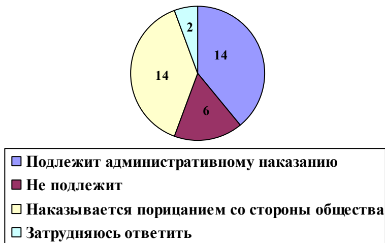
Рис 3. Подлежит ли наказанию курение в общественных местах?

недостаточное владение правовой информацией в области уголовного права.