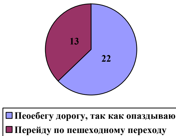
Рис 7. Ты очень опаздываешь на важную встречу. Выйдя из здания на противоположной стороне дороги, ты видишь интересующую тебя остановку. Перейти по переходу у тебя займет 10 минут. Как ты поступишь в данной ситуации?

стремления к правовому образованию, выражена мотивационная ограниченность в соблюдении и владении правовыми знаниями, умениями и навыками.