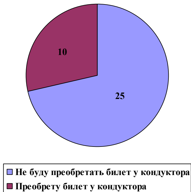
Рис 8. Ты приготовил деньги на оплату за проезд в общественном транспорте, но кондуктор не заметил тебя и прошел мимо. В данной ситуации ты

Таким образом, можно сделать вывод о том, что уровень сформированности правовой компетенции старших подростков в МАОУ СОШ № 28 находится на низком уровне. Диагностика когнитивного компонента правовой компетенции показала, что компонент сформирован на среднем уровне. Эмоционально-оценочный компонент находится на низком уровне, наблюдается отсутствие положительной мотивации и стремления к правовому образованию, выражена мотивационная ограниченность в соблюдении и владении правовыми знаниями, умениями и навыками. Диагностика поведенческого компонента показала, что большинство старших подростков не готовы действовать в соответствии со своими правовыми знаниями. Результаты диагностики (по респондентам) (Приложение 4)